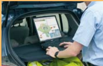
NAWIGACJA PRZEZ INTERNET